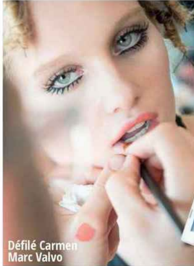
Défilé Carmen Marc Valvo

Oser les cils no limit. Grâce à des formules plus performantes, comme chez Ecrinal (pour stimuler la pousse des cils), et des mascaras toujours plus high-tech, comme le Dior, le cil de la rentrée 2017 est long, dense et recourbé comme jamais. Idéal pour reproduire en un clin d'œil les franges XXL repérées sur les shows Chanel, Moschino ou Jeremy Scott. Fortifiant Cils & Sourcils, 13 €, Ecrinal. Diorshow Pump'N'Volume, 35 €, Dior.