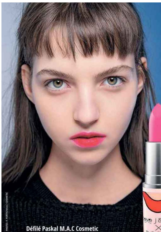
Défilé Paskal M.A.C Cosmetic