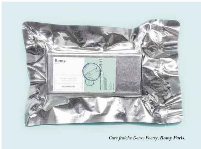
Cure fraîche Detox Poetry, Romy Paris.

Utilisés en circuit court, les actifs composant les soins seraient évidemment plus ciblés, mais aussi plus frais et plus sains. Plus ciblés ? Encore faut-il que le diagnostic de peau réalisé en amont soit pertinent... Certains déplorent que celui-ci soit plutôt un auto-diagnostic (notamment quand il s'effectue via un questionnaire en ligne). Quant à la fraîcheur, « l'argument est relatif car, dans un produit traditionnel, les ingrédients sont supposés être stables : malgré des temps de transport et de stockage longs, leur efficacité doit être intacte au moment de les consommer », nuance la biologiste et cosmétologue Sophie Strobel. Qu'en est-il de la qualité des ingrédients ? Tout dépend du cahier des charges de la marque, de sa façon de choisir et traiter